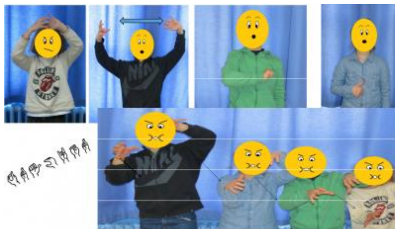
Les élèves de la classe de CE1 de l'école Painlevé (Lille - académie de Lille)