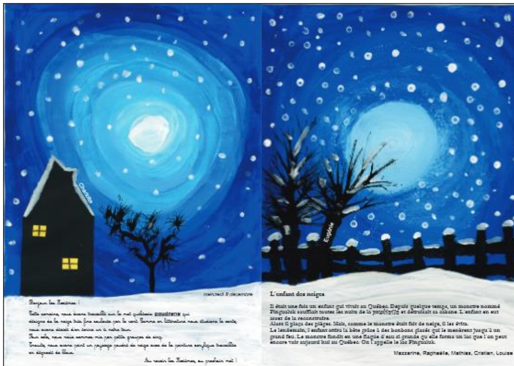
Les élèves de la classe de CM1,CM2 de l'école de Meyssac (Meyssac - académie de Limoges)