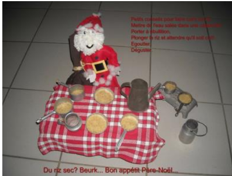
Les élèves de la classe de GS/CP de l'école de Sornay (Sornay - académie de Besançon)