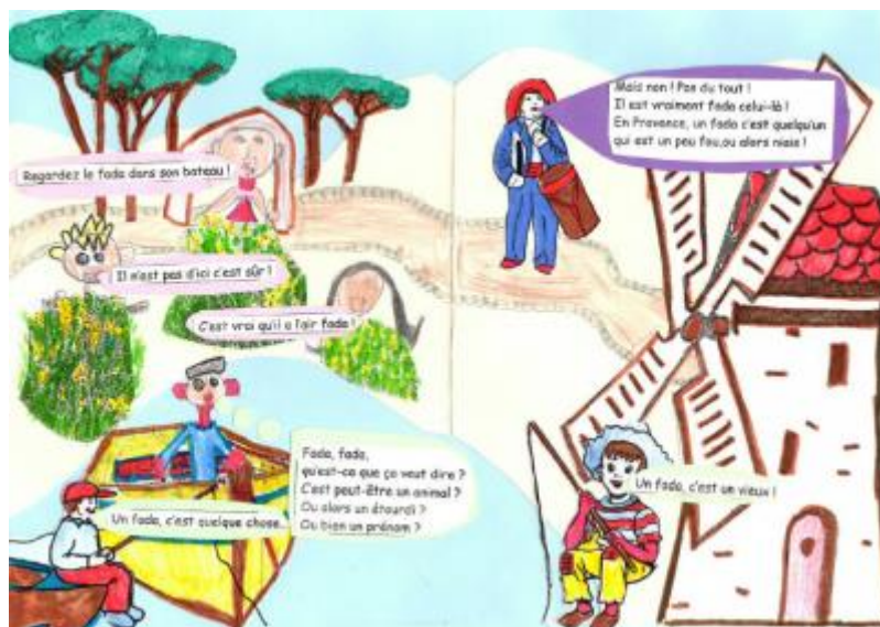
Les élèves de la classe de CP de l'école Risso (Nice - académie de Nice)