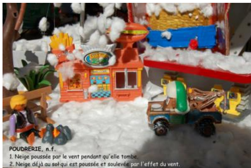
Les élèves de la classe de CM1,CM2 de l'école Christophe (Goyave - académie de Guadeloupe)