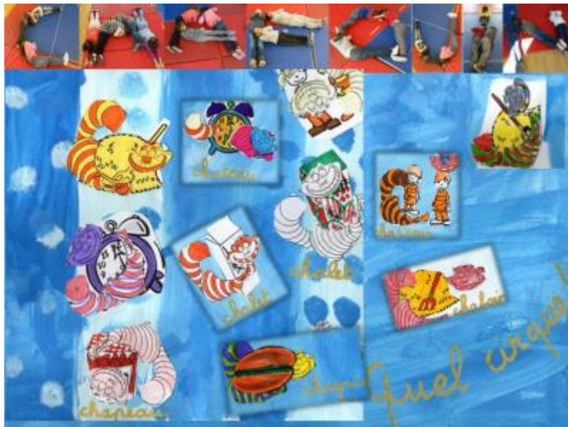
Les élèves de la classe de CE1 de l'école Saint Jean (Avignon- académie de Marseille)