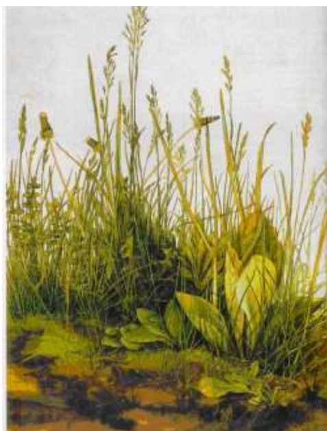
Albrecht Dürer "La grande touffe d'herbe" - 1503

Dans la peinture de la Renaissance, de petites touffes d'herbe dans un tableau ne font pas le sujet central de l'image mais marquent néanmoins une présence du végétal, alors qu'à la même époque Albrecht Dürer, au contraire, avait décidé d'en faire le sujet central de son œuvre désormais célèbre dans l'histoire de l'art « La grande touffe d'herbe »)